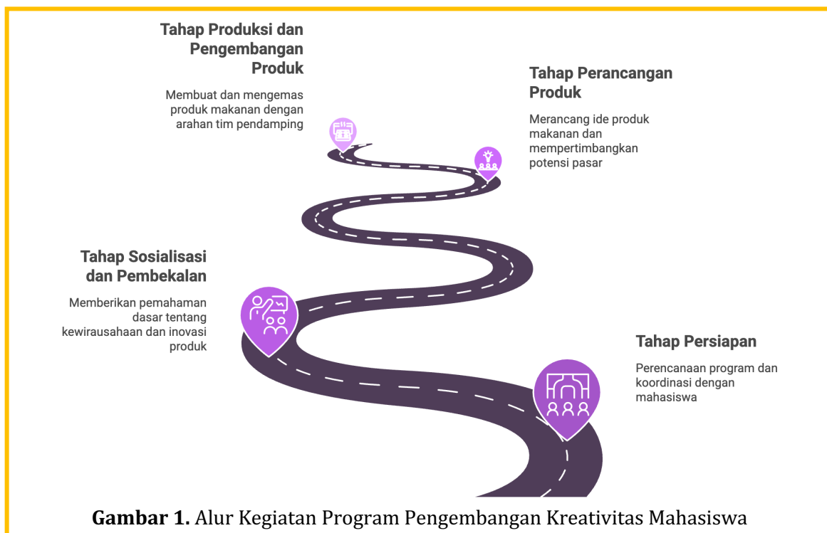
Gambar 1. Alur Kegiatan Program Pengembangan Kreativitas Mahasiswa

Program pengembangan kreativitas mahasiswa melalui kegiatan kewirausahaan dirancang sebagai upaya untuk mendorong mahasiswa agar mampu menghasilkan produk yang inovatif dan memiliki nilai ekonomi. Kegiatan ini tidak hanya berfokus pada aspek teori kewirausahaan, tetapi juga menekankan pada pengalaman praktik secara langsung dalam merancang, memproduksi, dan mengembangkan produk makanan. Pendekatan ini diharapkan dapat membantu mahasiswa memahami proses kewirausahaan secara lebih komprehensif, mulai dari tahap perencanaan hingga tahap produksi produk. Pelaksanaan kegiatan tersebut disusun secara sistematis melalui beberapa tahapan yang saling berkaitan. Setiap tahapan dirancang untuk memberikan pengalaman belajar yang bertahap dan terarah sehingga mahasiswa dapat mengembangkan kreativitas, kemampuan berpikir inovatif, serta keterampilan kerja sama dalam tim. Alur kegiatan program pengembangan kreativitas mahasiswa dapat dilihat pada gambar berikut.