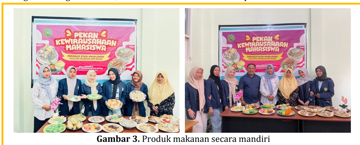
Gambar 3. Produk makanan secara mandiri

Proses produksi dilakukan secara berkelompok sehingga mahasiswa dapat saling bekerja sama dalam menyelesaikan setiap tahapan pembuatan produk. Setiap anggota kelompok memiliki peran masing-masing, mulai dari menyiapkan bahan, mengolah produk, hingga menata hasil akhir produk yang telah dibuat. Pendampingan dari tim pelaksana membantu mahasiswa memahami teknik pengolahan yang tepat serta memberikan arahan agar produk yang dihasilkan memiliki kualitas yang baik. Selain proses produksi, mahasiswa juga belajar mengenai pentingnya pengemasan produk sebagai salah satu faktor yang dapat meningkatkan daya tarik produk makanan. Mahasiswa mencoba menata dan mengemas produk dengan tampilan yang menarik agar lebih mudah dikenali dan diminati oleh konsumen. Proses pengemasan ini membantu mahasiswa memahami bahwa tampilan produk merupakan bagian penting dalam kegiatan usaha, terutama dalam menarik minat pembeli.