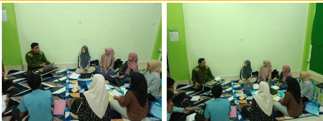
Gambar 3. Rancang Materi Sosialisasi Berbasis Data Lapangan

tawaran solusi yang dapat diterapkan secara kolaboratif. Alur penyajian yang terstruktur membantu peserta memahami proses analisis secara logis dan komprehensif. Setiap solusi yang ditawarkan disesuaikan dengan kapasitas sekolah sehingga lebih realistis untuk diimplementasikan. Pendekatan ini mendorong partisipasi aktif seluruh warga sekolah dalam proses perbaikan budaya sekolah. Penggunaan bahasa yang komunikatif serta penyajian yang interaktif menjadi perhatian utama dalam penyusunan materi sosialisasi. Materi dirancang agar mudah dipahami oleh guru maupun siswa tanpa mengurangi kedalaman substansi. Metode penyampaian yang digunakan meliputi diskusi kelompok, studi kasus, serta refleksi bersama sehingga tercipta ruang dialog yang terbuka. Strategi ini tidak hanya meningkatkan pemahaman peserta, tetapi juga menumbuhkan kesadaran kolektif untuk membangun budaya sekolah yang lebih positif dan berkelanjutan.