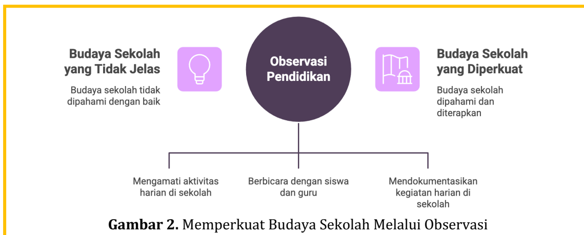
Gambar 2. Memperkuat Budaya Sekolah Melalui Observasi

Interaksi sosial antarwarga sekolah juga terpetakan dengan jelas melalui kegiatan observasi. Pola komunikasi antara guru dan siswa, hubungan antarsiswa, serta budaya saling menghargai menjadi indikator penting dalam menilai iklim sekolah. Hasil pengamatan memberikan gambaran mengenai sejauh mana nilai-nilai seperti kerja sama, toleransi, dan empati telah berkembang dalam kehidupan sekolah sehari-hari. Kebiasaan belajar serta nilai-nilai karakter yang berkembang di lingkungan sekolah turut teridentifikasi secara komprehensif. Observasi terhadap proses pembelajaran menunjukkan tingkat partisipasi siswa, kemandirian dalam menyelesaikan tugas, serta sikap tanggung jawab terhadap kegiatan akademik. Pemetaan ini menjadi dasar penting dalam merancang program sosialisasi yang relevan dan kontekstual, sehingga penguatan budaya sekolah dapat dilakukan secara lebih terarah dan berkelanjutan.