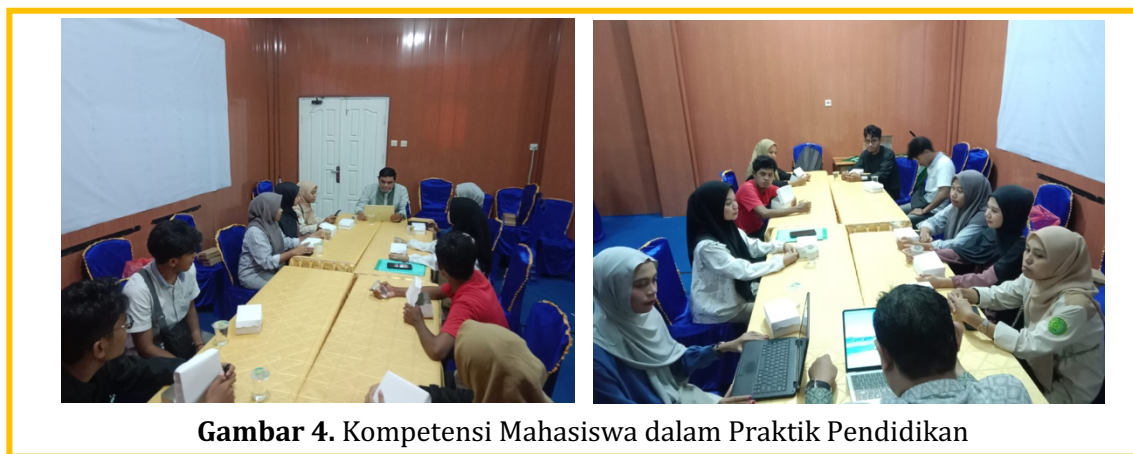
Gambar 4. Kompetensi Mahasiswa dalam Praktik Pendidikan

Pelaksanaan kegiatan sosialisasi juga melatih kompetensi sosial mahasiswa. Interaksi dengan guru, siswa, dan pihak sekolah mengembangkan kemampuan komunikasi, kerja sama tim, serta adaptasi terhadap lingkungan baru. Mahasiswa belajar membangun hubungan yang kolaboratif dan menghargai perspektif berbagai pihak dalam konteks pendidikan. Tahap evaluasi dan refleksi memperkuat sikap profesional dan tanggung jawab akademik mahasiswa. Mahasiswa diajak menilai efektivitas kegiatan serta mengidentifikasi aspek yang perlu diperbaiki. Proses reflektif ini membentuk pola pikir pembelajar sepanjang hayat dan meningkatkan kesiapan mahasiswa dalam menghadapi tantangan praktik pendidikan di masa mendatang.