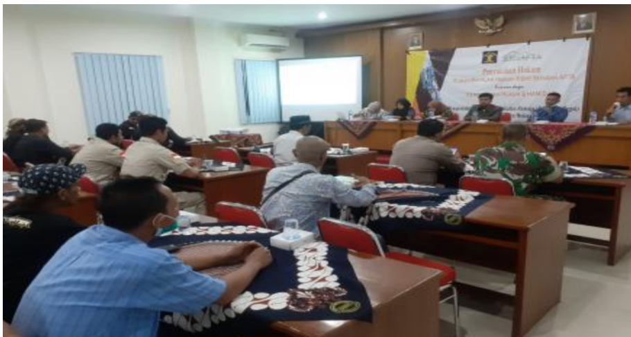
Gambar 4. Penyuluhan Hukum Pidana Berbasis Digital

meningkatkan partisipasi aktif serta efektivitas proses pembelajaran hukum bagi kelompok mitra.