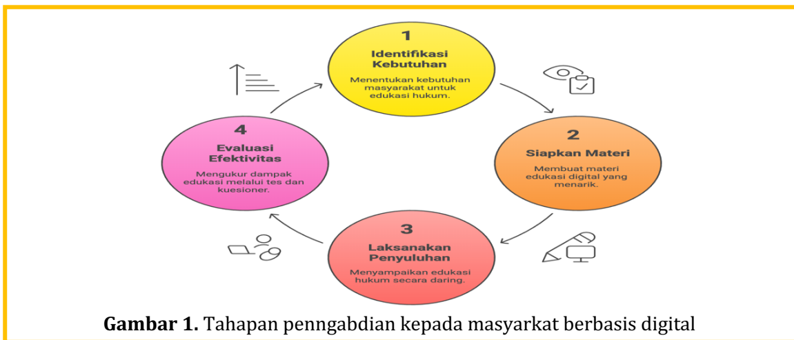
Gambar 1. Tahapan pengabdian kepada masyarakat berbasis digital

Kegiatan pengabdian kepada masyarakat ini dilaksanakan menggunakan pendekatan edukatif dan partisipatif dengan memanfaatkan media digital sebagai sarana utama penyampaian materi hukum pidana. Pendekatan edukatif digunakan untuk meningkatkan pengetahuan dan pemahaman masyarakat mengenai konsep dasar hukum pidana, sedangkan pendekatan partisipatif bertujuan mendorong keterlibatan aktif peserta melalui diskusi dan tanya jawab (Mardikanto & Soebiato, 2019). Model ini dipilih karena dinilai efektif dalam kegiatan pemberdayaan masyarakat yang berorientasi pada peningkatan kapasitas dan kesadaran hukum. Sasaran kegiatan adalah masyarakat umum dengan latar belakang pendidikan yang beragam. Pelaksanaan kegiatan dilakukan melalui tiga tahapan, yaitu tahap persiapan, pelaksanaan, dan evaluasi. Pada tahap persiapan, tim pengabdian melakukan identifikasi kebutuhan mitra serta menyusun materi edukasi hukum pidana dalam bentuk digital, seperti presentasi visual dan video edukatif. Tahap pelaksanaan dilakukan melalui penyuluhan hukum pidana secara daring dengan memanfaatkan platform digital yang mudah diakses oleh peserta. Materi yang disampaikan meliputi pengertian hukum pidana, jenis tindak pidana, serta hak dan kewajiban hukum masyarakat.