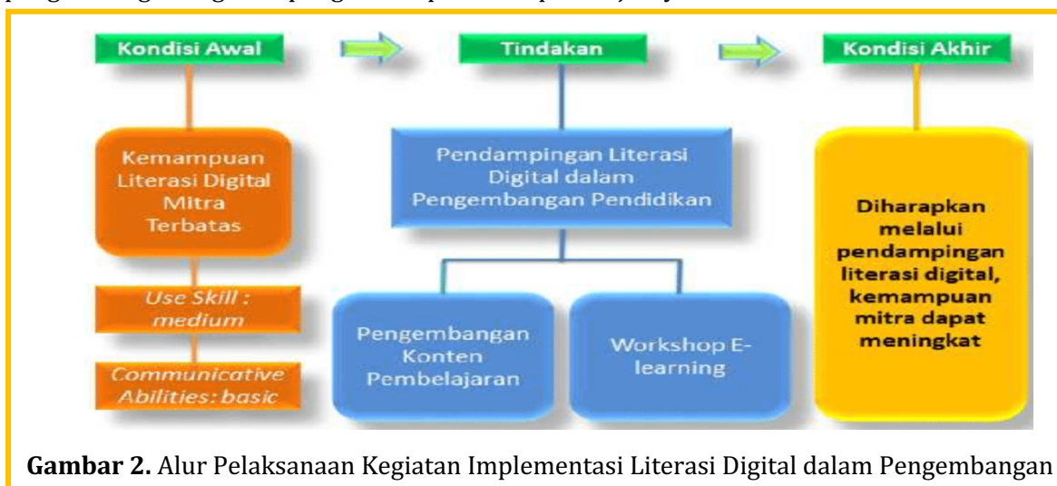
Gambar 2. Alur Pelaksanaan Kegiatan Implementasi Literasi Digital dalam Pengembangan

Tabel ini menggambarkan secara sistematis tahapan pelaksanaan kegiatan pengabdian kepada masyarakat yang berbasis edukasi hukum pidana digital, mulai dari tahap persiapan hingga evaluasi. Pada tahap persiapan, kegiatan difokuskan pada identifikasi kebutuhan mitra untuk memetakan permasalahan literasi hukum yang dihadapi masyarakat. Berdasarkan hasil pemetaan tersebut, dilakukan penyusunan materi hukum pidana dalam format digital serta penyiapan platform digital yang akan digunakan, sehingga modul dan media edukasi siap diimplementasikan secara efektif. Tahap pelaksanaan menekankan pada proses transfer pengetahuan dan peningkatan partisipasi masyarakat melalui penyampaian materi hukum pidana, pemutaran video edukasi, serta diskusi dan tanya jawab secara daring. Tahap evaluasi dilakukan untuk mengukur efektivitas kegiatan melalui pelaksanaan pre-test dan post-test guna melihat peningkatan literasi hukum peserta, penyebaran kuesioner kepuasan untuk memperoleh umpan balik, serta refleksi kegiatan sebagai dasar penyusunan rekomendasi pengembangan kegiatan pengabdian pada tahap selanjutnya.