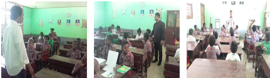
Gambar 1. Kegiatan Pemateri tentang Nilai-Nilai Anti Korupsi

Proses pengenalan nilai-nilai anti korupsi di SD Inpres Mangga Dua dilakukan melalui metode sosialisasi partisipatif edukatif yang bersifat interaktif. Melalui pendekatan ini, siswa tidak hanya mendengar penjelasan, tetapi juga terlibat dalam diskusi, permainan peran, dan kegiatan berbasis pengalaman nyata. Contohnya, saat siswa diajak bermain simulasi tentang "menemukan uang yang bukan miliknya", mereka langsung mengaitkan dengan pengalaman pribadi menyerahkan dompet yang ditemukan kepada guru sebuah cerminan nyata dari nilai jujur. Nilai tanggung jawab diperkenalkan melalui kegiatan kelompok yang menuntut siswa menyelesaikan tugas secara adil dan saling membantu.