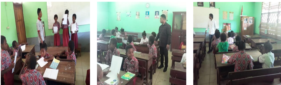
Gambar 3. Evaluasi dalam kegiatan presentasi dan kuis

Setelah kegiatan pengenalan dan pengamalan nilai-nilai anti korupsi melalui metode sosialisasi partisipatif edukatif, terlihat adanya peningkatan pemahaman siswa terhadap sembilan nilai dasar yang ditetapkan KPK, yakni jujur, disiplin, tanggung jawab, kerja keras, mandiri, sederhana, adil, berani, dan peduli. Hasil kuis menunjukkan mayoritas siswa mampu menyebutkan dan menjelaskan arti sembilan nilai tersebut dengan bahasa mereka sendiri. Hal ini diperkuat dengan pengisian