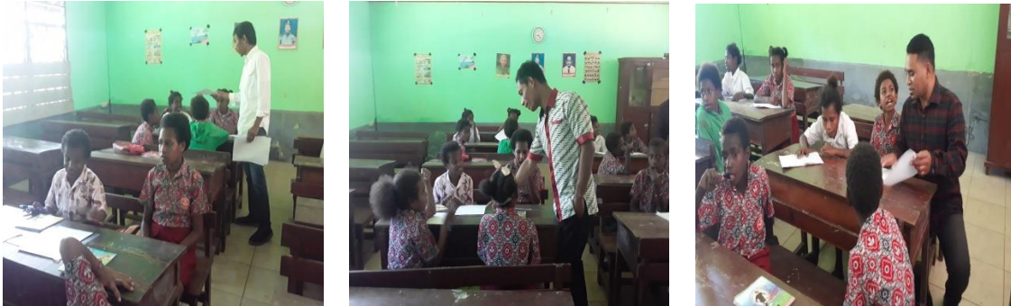
Gambar 2. Pengamalan Nilai oleh Siswa dalam Berdiskusi

Setelah proses pengenalan nilai dilakukan melalui sosialisasi partisipatif edukatif, siswa mulai menunjukkan pemahaman melalui tindakan nyata dalam aktivitas sehari-hari di kelas. Nilai kejujuran tercermin saat siswa berani mengakui kesalahan atau menolak menyontek saat latihan soal. Kepedulian dan kedisiplinan terlihat saat mereka saling membantu merapikan meja dan tertib antri sebelum masuk kelas. Seorang siswa bahkan memilih untuk mengembalikan pena temannya yang tertinggal, mencerminkan tanggung jawab dan keteladanan.