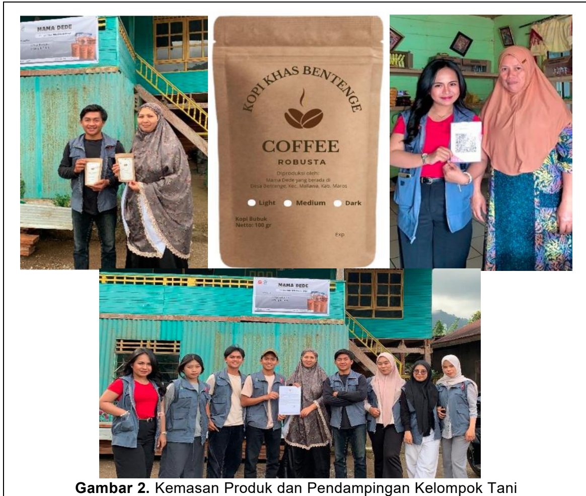
Gambar 2. Kemasan Produk dan Pendampingan Kelompok Tani