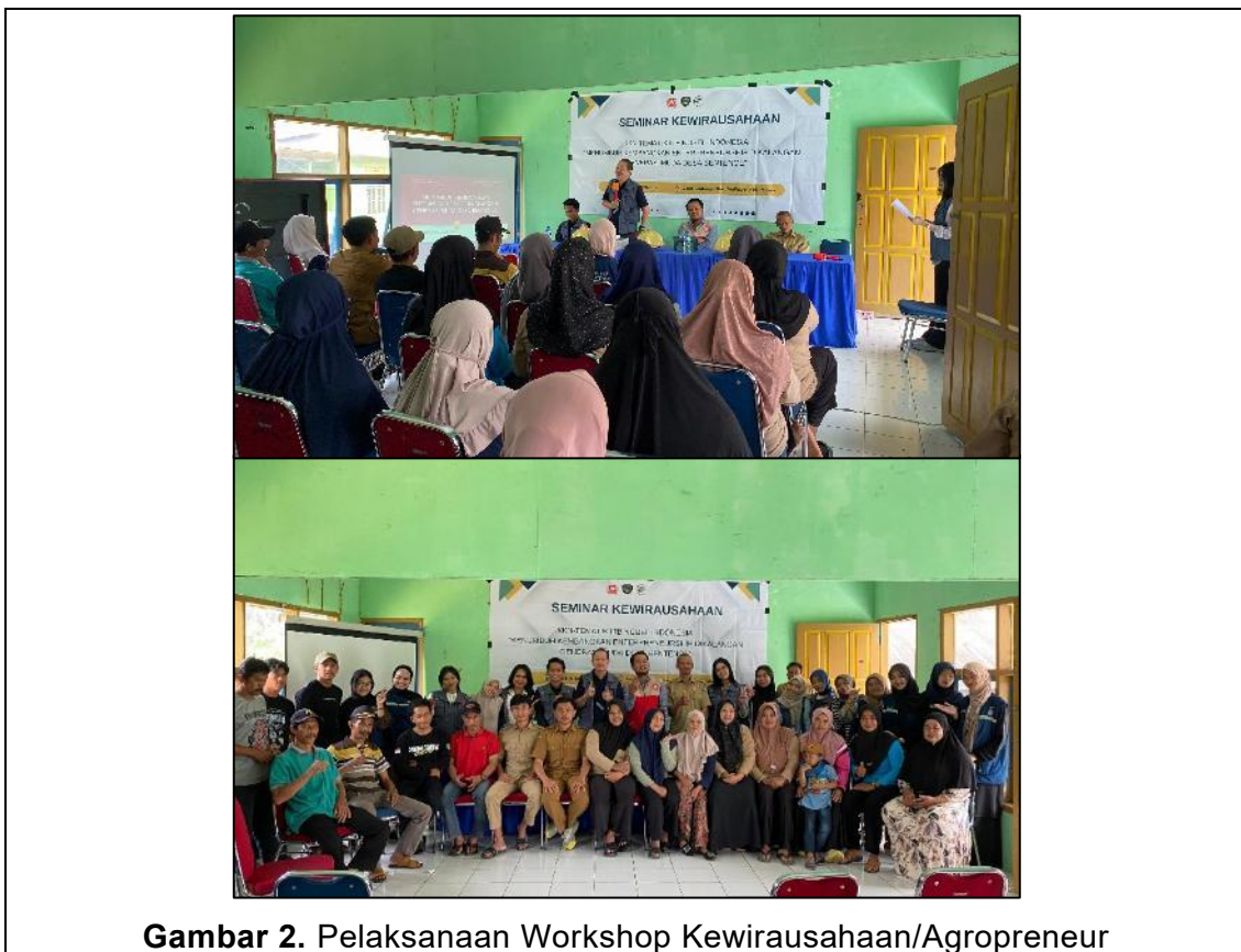
Gambar 2. Pelaksanaan Workshop Kewirausahaan/Agropreneur

Pelaksanaan workshop kewirausahaan dilakukan secara partisipatif dengan menekankan keterlibatan aktif mitra pada setiap sesi pelatihan. Pendekatan learning by doing diterapkan untuk memastikan mitra tidak hanya memahami konsep, tetapi juga mampu melakukan seluruh proses produksi dan pengemasan secara mandiri. Dokumentasi pelaksanaan workshop kewirausahaan atau agropreneur ditampilkan pada Gambar 2.