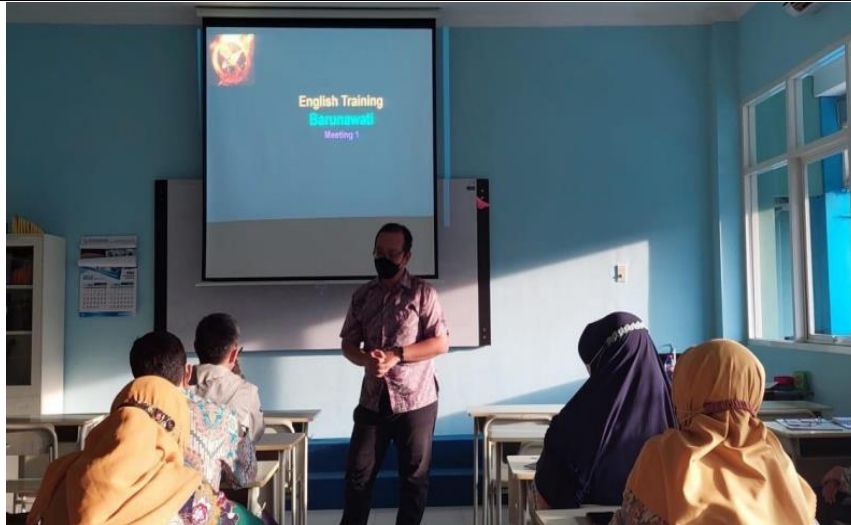
Gambar 2. Sesi Penjelasan Tentang Metode Toastmasters