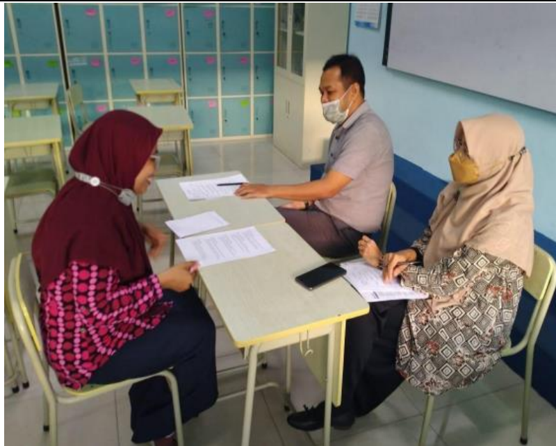
Gambar 4. Speaking Test

Secara keseluruhan, kedua tes menunjukkan adanya peningkatan moderat dalam kemampuan bahasa Inggris, terutama pada aspek kelancaran dan keteraturan dalam berbicara, meskipun masih ada ruang perbaikan pada tata bahasa dan kosa kata untuk mencapai tingkat yang lebih tinggi secara konsisten.