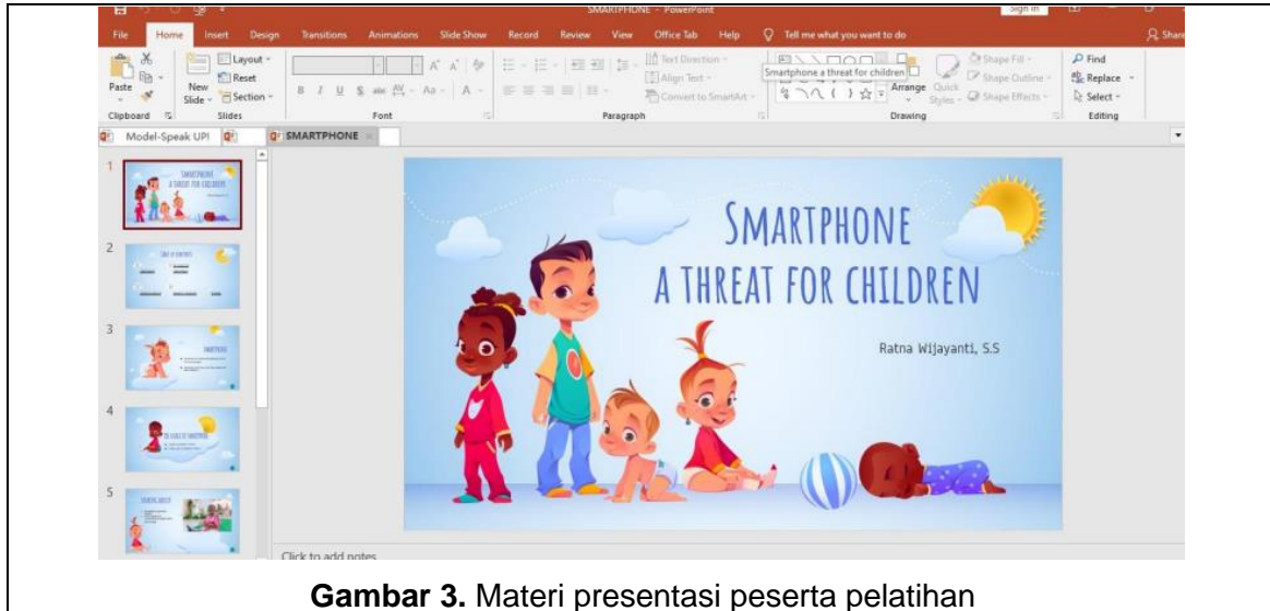
Gambar 3. Materi presentasi peserta pelatihan

Pada pertemuan kelima, evaluasi pertama pembelajaran dilaksanakan dalam bentuk speaking test bagi seluruh peserta pelatihan. Speaking test dibagi menjadi empat yaitu percakapan pendahuluan, deskripsi gambar, diskusi kolaboratif, dan diskusi lanjutan. Peserta berinteraksi dalam pasangan berbicara tentang topik umum, mendeskripsikan gambar, dan berdiskusi untuk menguji kelancaran, kekayaan kosa kata, tata bahasa, dan pengucapan. Setiap bagian memiliki fokus yang berbeda, mulai dari keterampilan berbicara sehari-hari hingga diskusi yang lebih kompleks. Tes ini bertujuan untuk mengukur kemampuan berkomunikasi secara efektif dalam berbagai situasi.