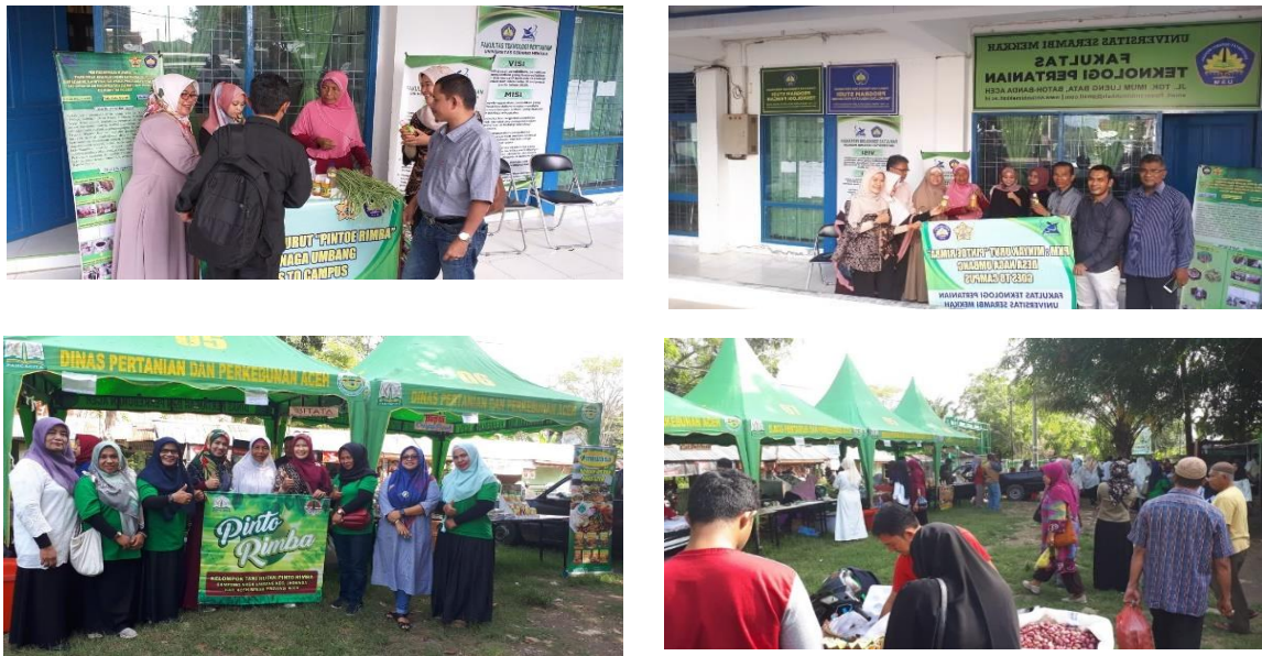
Gambar 7. Pendampingan Pemasaran Melalui “Minyak Naga Umbang Goes To Kampus” dan Pendampingan di Pasar Tani yang Dilaksanakan Setiap Rabu Oleh Dinas Perkebunan dan Pertanian Aceh