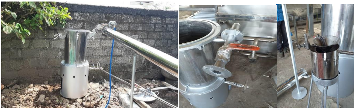
Gambar 3. Alat Destilasi yang Sudah Jadi Dengan Kapasitas 5 kg

Alat destilasi ini berkapasitas 5 kg/proses dengan diameter ketel kurang lebih 380 mm dan tinggi 650 mm. Pendingin dikembangkan dengan model multi turbin dengan diameter 4 inchi, panjang 1,5 meter dengan bahan stainless steel . Pemanas dilakukan dengan LPG. Pengembangan alat destilasi ini dilengkapi dengan tabung pemisah minyak, pressure gauge , thermometer , safety valve , tungku pembakaran dan kompor gas.