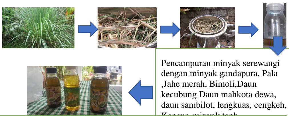
Gambar 5. Alir Pembuatan Minyak “ Pintoe Rimba ” Naga Umbang

Adapun alir proses pembuatan minyak “ Pintoe Rimba ” Naga Umbang