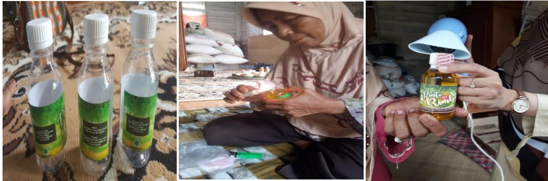
Gambar 6. Kemasan Botol Minyak Urut “ Pintoe Rimba ” (Kiri) dan Pengemasan Yang Masih Dilakukan Secara Tradisional Dengan Lilin (Tengah) dan Pengemasan Dengan Hairdryer (Kanan).