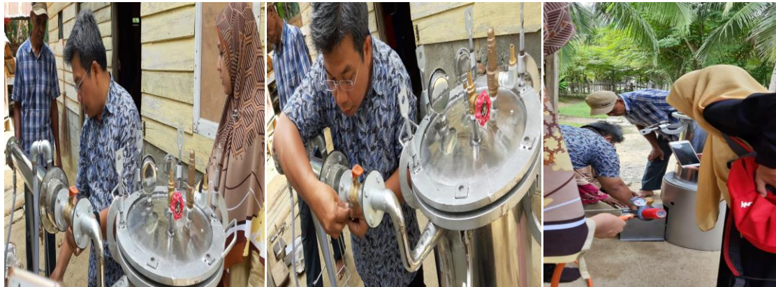
Gambar 4. Pelatihan Penggunaan Alat Destilasi

tanaman sere wangi dengan kapasitas 5 kg yang selanjutnya dimasukkan ke dalam alat destilasi.