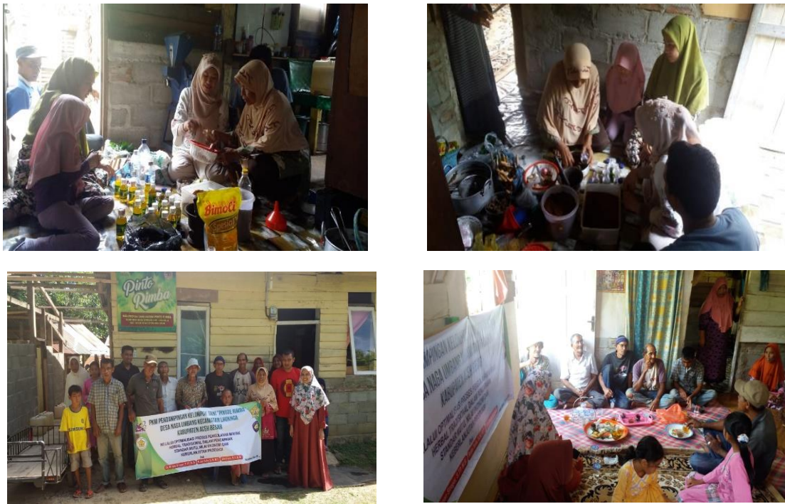
Gambar 1. Kegiatan Sosialisasi dan Penyuluhan PKM ke Kelompok Minyak Urut “Pintoe Rimba”

Lhoknga Aceh Besar memiliki semangat dan kepercayaan diri dalam berwirausaha serta merubah pola pikir masyarakat tentang peningkatan ekonomi keluarga. Kegiatan Dalam tahapan ini sebelumnya dilakukan sosialisasi dengan menghubungi Ketua Kelompok Tani untuk mendiskusikan sekaligus meminta ijin serta berkoordinasi agar Program Kemitraan Masyarakat (PKM) ini dapat berlangsung dengan lancar.