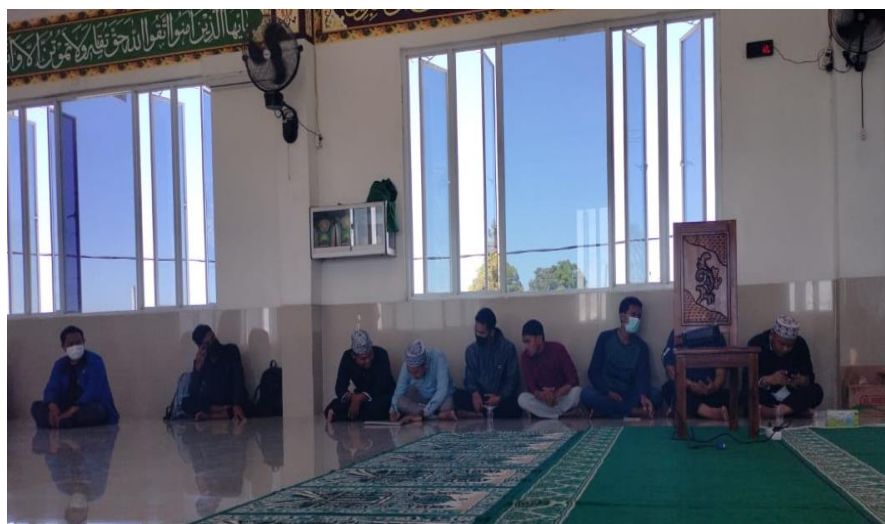
Gambar 2. Tahap Pelatihan dan Pendampingan