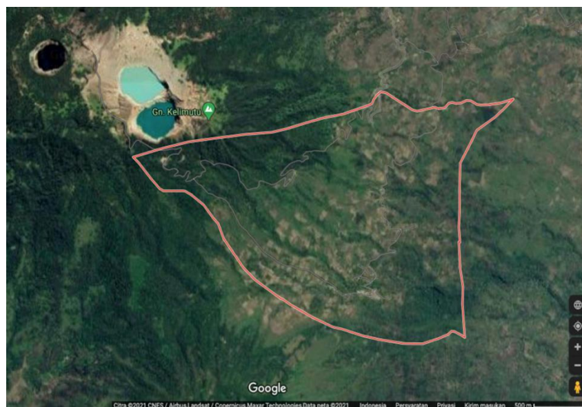
Gambar 1. Lokasi Desa Pemo

Sebagai salah satu desa penyangga kawasan taman nasional Kelimutu, Desa Pemo memiliki beberapa potensi wisata yang bisa dikembangkan untuk meningkatkan kesejahteraan masyarakat desa. Lokasi Desa Pemo berada paling dekat dengan objek wisata Danau Kelimutu, bisa dikatakan Pemo merupakan desa yang berada pada tempat atau lokasi tertinggi di Kabupaten Ende. Sayangnya meskipun akses menuju objek wisata Danau Kelimutu sangat baik namun untuk menuju Desa Pemo perlu perhatian lebih serius baik dari pemerintah desa maupun kabupaten.