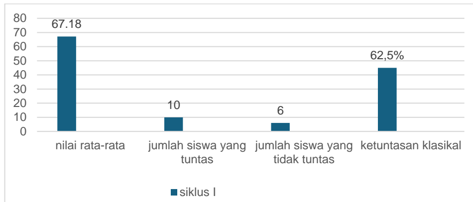
Gambar 1. Nilai Tes Siklus I

Setelah peneliti menampilkan nilai hasil belajar siswa kelas I pada siklus I dalam bentuk tabel, selanjutnya peneliti akan menampilkan hasil belajar siswa dalam bentuk grafik. Adapun grafik dapat dilihat dibawah ini: