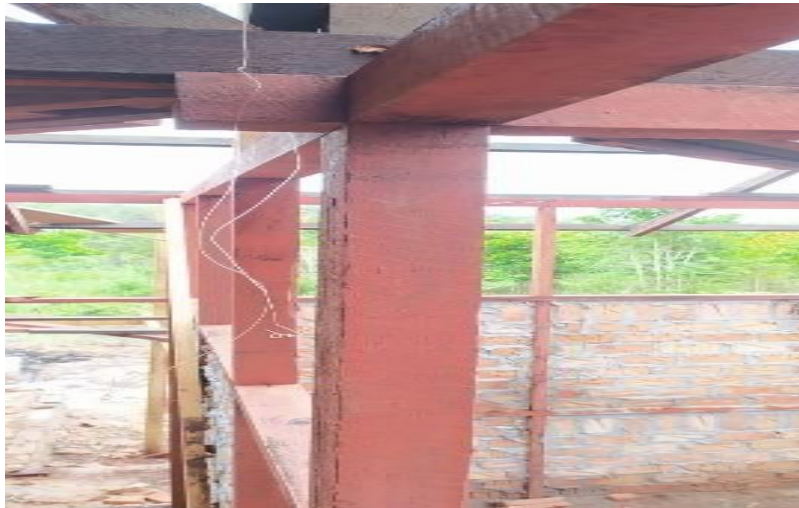
Gambar 6. Balok Ringbalk Pada Rumah Kancingan

Sebagai terlihat pada Gambar 6, elemen ringbalok pada konstruksi rumah kancingan menggunakan balok kayu berukuran 8/8 cm yang berfungsi sebagai elemen pengikat horizontal untuk meneruskan beban lateral dari sistem kuda-kuda atap ke kolom struktur. Keberadaan ringbalok menjadi komponen penting dalam menjaga stabilitas keseluruhan bangunan, khususnya dalam menahan gaya horizontal yang dihasilkan oleh beban angin maupun getaran akibat aktivitas seismik.