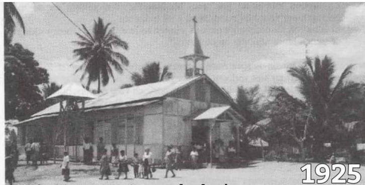
Gereja ST. Theresia Buti yang Masih Menggunakan Material Gaba-Gaba

Pada periode tahun 1950-an, ketika pemerintah kolonial Belanda membangun rumah pegawai dan fasilitas publik, terjadi transformasi signifikan dengan penggunaan dinding pengisi batubata. Perubahan ini dilakukan untuk meningkatkan kekokohan struktur dan memenuhi kebutuhan durabilitas bangunan modern. Dokumentasi mengenai proses pembangunan dinding bata ditunjukkan secara jelas pada Gambar 2, yang menggambarkan pergantian material dinding dari gaba-gaba ke pasangan bata. Bangunan peninggalan Belanda yang masih berdiri hingga kini menjadi bukti fisik keberhasilan penerapan teknologi konstruksi bata pada sistem rangka kayu (kancingan).