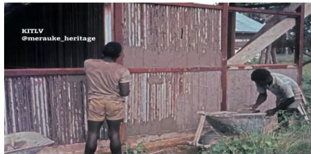
Proses Pemasangan Dinding Gaba-Gaba Rumah Kancingan