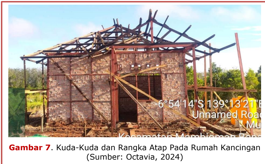
Gambar 7. Kuda-Kuda dan Rangka Atap Pada Rumah Kancingan

Gambar 7 memperlihatkan sistem rangka atap pada rumah kancingan menggunakan konstruksi kuda-kuda kayu mutu E15, dengan dimensi elemen struktur berupa ukuran 5/10 cm untuk batang kuda-kuda dan balok skor, 5/7 cm untuk gording, serta 5/10 cm untuk balok nok. Pemilihan kayu mutu E15 didasarkan pada kekuatan lentur dan ketahanan struktural yang memadai untuk menahan beban gravitasi maupun beban lateral yang bekerja pada sistem atap.