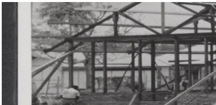
Pembangunan Perumahan Pegawai Belanda yang Menggunakan Material Dinding Batu Bata, Tahun 1950-an