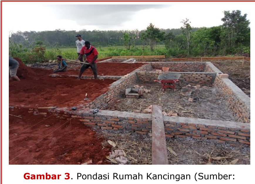
Gambar 3. Pondasi Rumah Kancingan