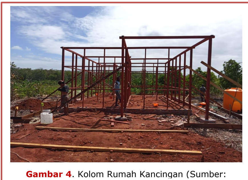
Gambar 4. Kolom Rumah Kancingan

Struktur utama bangunan menggunakan kolom kayu berukuran 8/8 cm, biasanya terbuat dari kayu meranti atau kayu bus yang termasuk kategori kayu kuat kelas II. Kolom kayu berfungsi sebagai elemen pemikul utama yang menyalurkan beban atap ke pondasi. Dokumentasi kolom ditunjukkan pada Gambar 4, yang memperlihatkan posisi dan hubungan kolom dalam sistem struktur kancingan.