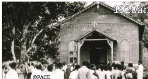
Gereja ST. Theresia Buti yang Masih Menggunakan Material Gaba-Gaba