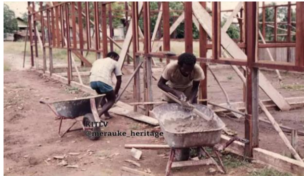
Proses Pembangunan Rumah Kancingan Dinding Gaba-Gaba

memperkenalkan teknik konstruksi berbasis material lokal. Dokumentasi visual penggunaan gaba-gaba sebagai dinding terlihat jelas pada Gambar 1 dalam dokumen, yang memperlihatkan proses pemasangan material tersebut pada konstruksi tombolan.