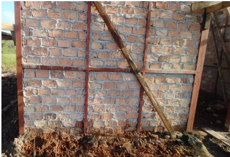
Gambar 5. Dinding Rumah Kancingan