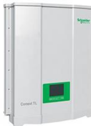
Gambar 4.3 Inverter 10 kWac