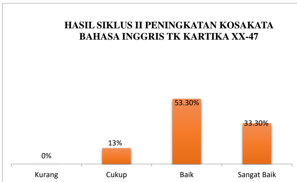
Grafik 1 presentase peningkatan kosakata bahasa Inggris anak pada siklus II

Data Peningkatan ini juga dapat dilihat secara visual pada diagram perbandingan berikut: