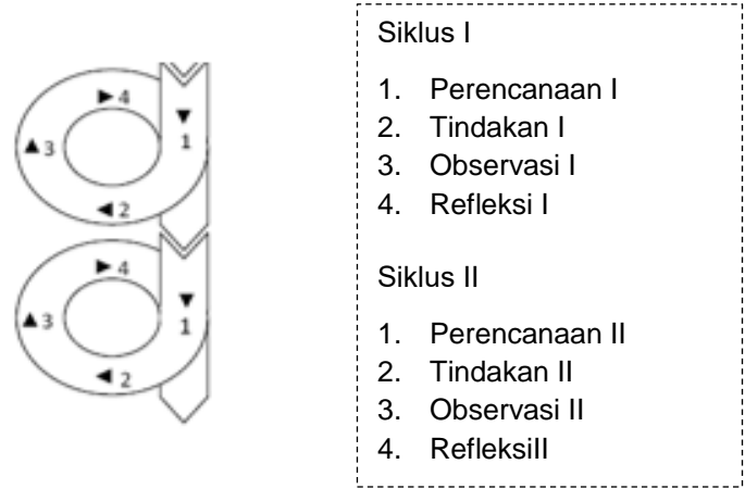
Gambar 1. Desain PTK Model Kemmis & Mc. Taggart (Suharsimi Arikunto dalam Siti Khotimah, 2018)

penelitian yang digunakan adalah desain penelitian yang dikembangkan oleh Kemmis dan Mc yang disebut dengan desain putaran spiral. Penelitian ini dilaksanakan dalam beberapa siklus dengan setiap siklusnya terdiri dari tahapan-tahapan yaitu : perencanaan ( planning ), tindakan ( action ), observasi ( observation ). Siklus dihentikan jika peneliti dan guru kelas sepakat bahwa hasil belajar IPAS siswa kelas IV dengan menggunakan menggunakan media gambar berhasil atau meningkat. Untuk lebih jelasnya dapat dilihat pada gambar 1 dibawah ini :